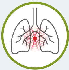
مشکل در تنفس